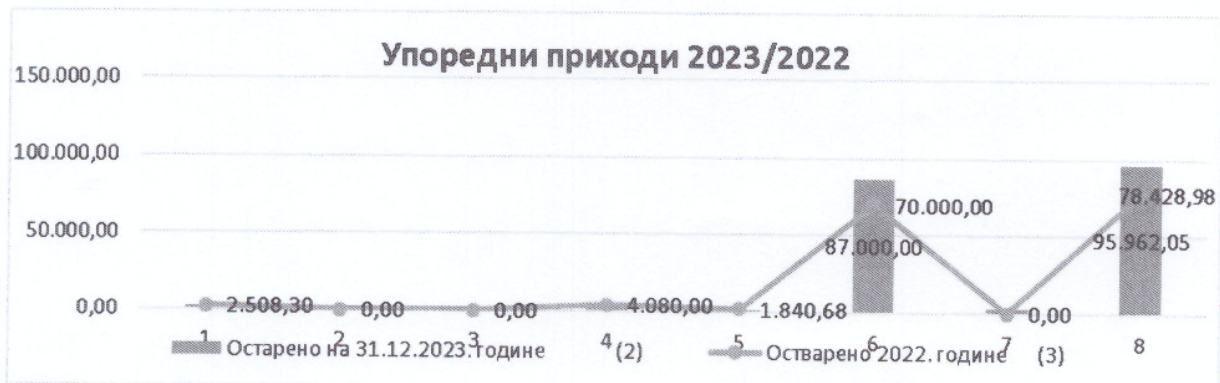
Графикон 2 Упоредни приказ 2023/2022

Без обзира на све, постепена санација, појачане активности, условиле се у 2023. години раст прихода.