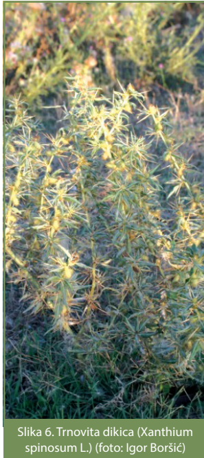
Slika 6. Trnovita dikica (Xanthium spinosum L.)