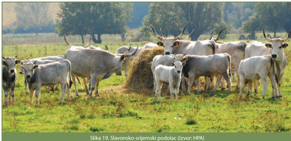
Slika 19. Slavonско-srijemski podolac