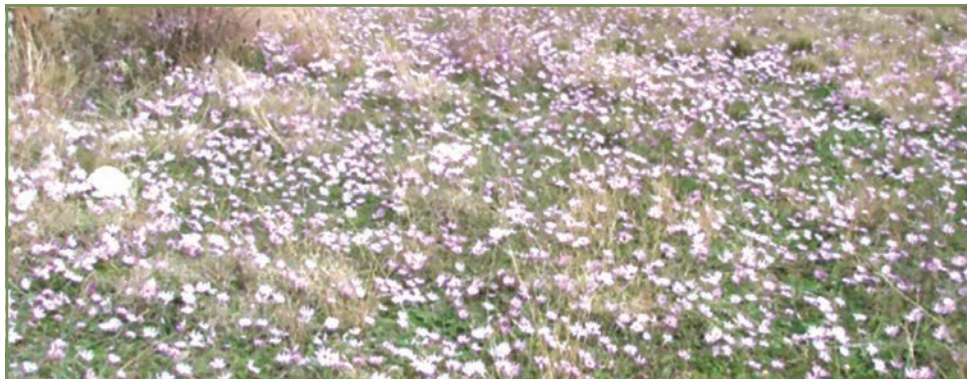
Slika 3. Mediteranski suhi travnjak

Prostire se na mediteranskom području Hrvatske, nadmorske visine ispod 200 metara, kao i na otocima. Košnju na ovom području potrebno je provoditi nakon 15. srpnja, jednom godišnje , kako bi sve biljne vrste koje cvatu u svibnju i lipnju završile svoj vegetacijski ciklus i uspjele se razmnožiti. Osim toga, košnja u ovom razdoblju otvara stanište i omogućava cvatnju nekih kasnijih biljnih vrsta, koje će cvjetati u kolovozu.