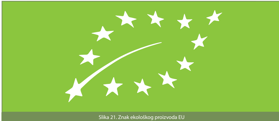
Slika 21. Znak ekološkog proizvoda EU