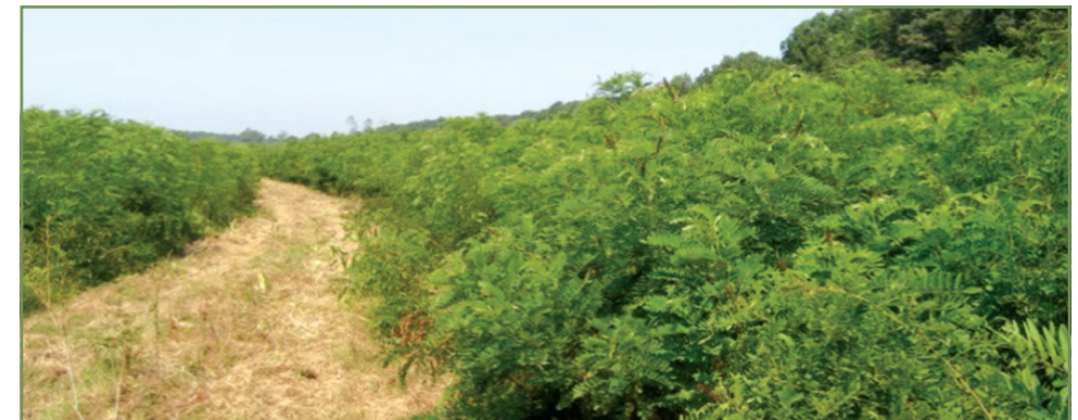
Slika 4. Parcela obrasla čivitnjačom ( Amorpha fruticosa L.)

Hidromelioracijski zahvati (odvodnja ili navodnjavanje) nisu dozvoljeni niti na jednom tipu TVPV.