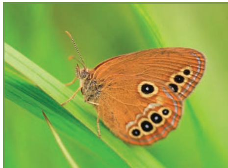
Slika 12. Močvarni okaš ( Coenonympha oedippus ).