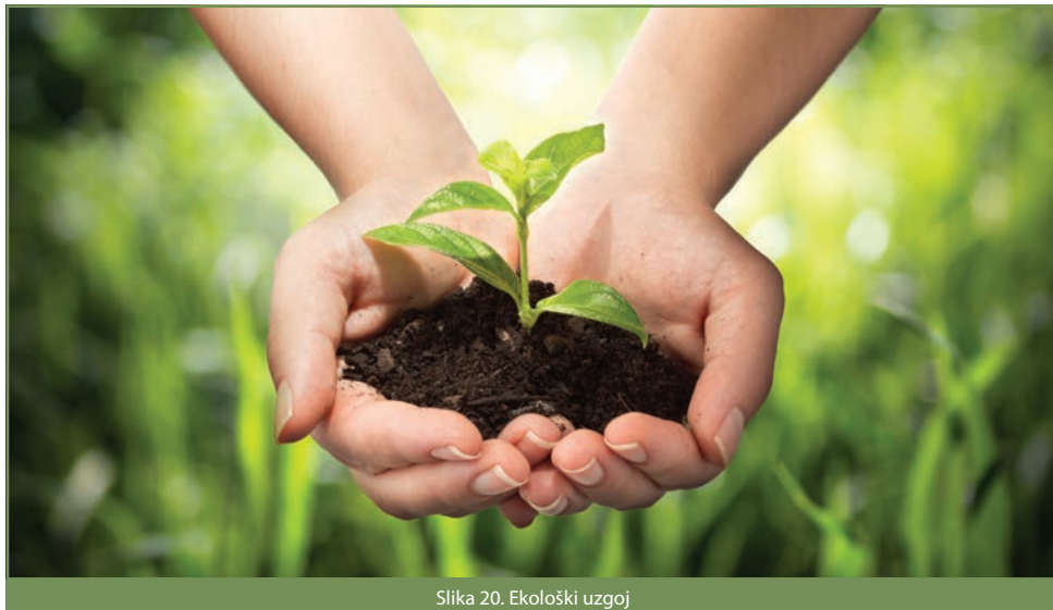
Slika 20. Ekološki uzgoj

Ekološka je proizvodnja sveobuhvatan sustav upravljanja poljoprivrednim gospodarstvima i proizvodnjom hrane koji ujedinjuje najbolju praksu zaštite okoliša i klime, visoku razinu biološke raznolikosti, očuvanje prirodnih resursa, primjenu visokih standarda za dobrobit životinja i proizvodne standarde koji su u skladu s potražnjom sve većeg broja potrošača.