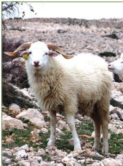
Slika 17. Paška ovca

Potpore predstavljaju naknadu korisniku za gubitak prihoda i dodatne troškove koji su rezultat držanja i uzgoja ugroženih izvornih i zaštićenih pasmina domaćih životinja.