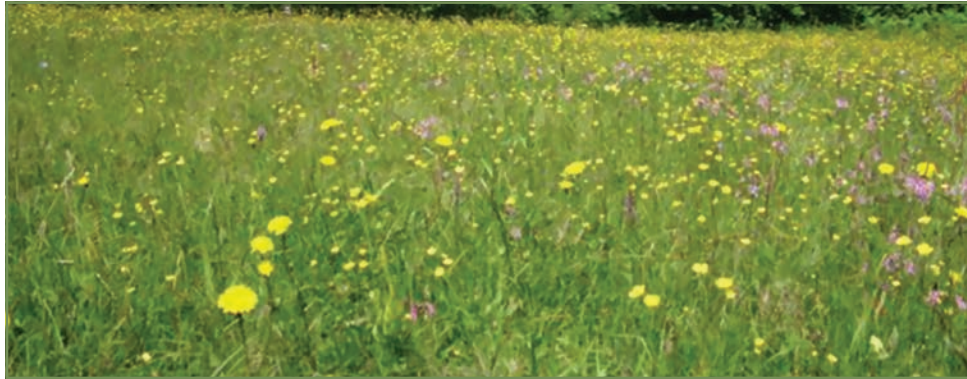
Slika 2. Brdski travnjak bogat različitim biljnim vrstama