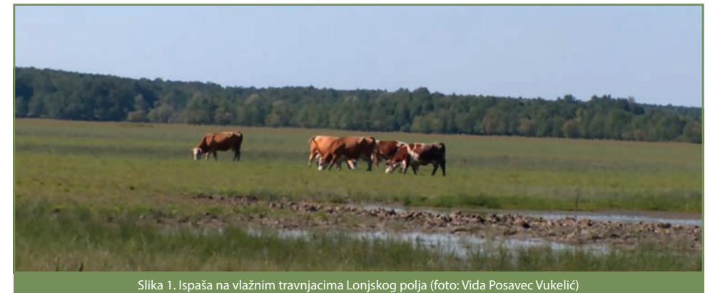
Slika 1. Ispaša na vlažnim travnjacima Lonjskog polja

Ova regija obuhvaća čitav nizinski dio kontinentalne Hrvatske do otprilike 200 metara nadmorske visine, a u njoj prevladavaju manje ili više vlažni travnjaci koji su se tradicionalno nisu kosili uglavnom jednom godišnje, jer bi učestala košnja dovela do isušivanja travnjaka i promjene biljnih vrsta koji se na njima nalaze. Košnja se treba provoditi nakon 1. kolovoza, samo jednom godišnje.