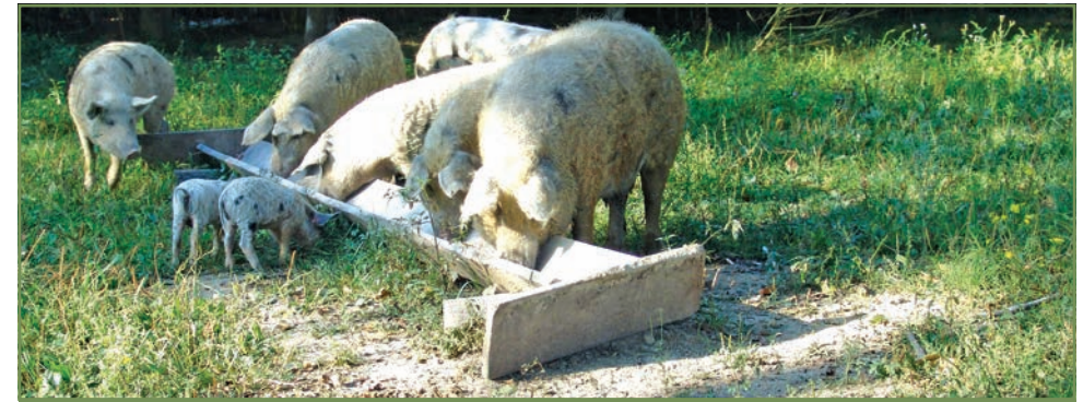
Slika 13. Turopoljska svinja