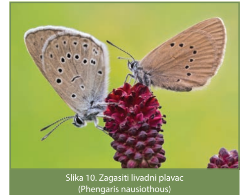
Slika 10. Zagasiti livadni plavac ( Phengaris nausithous )