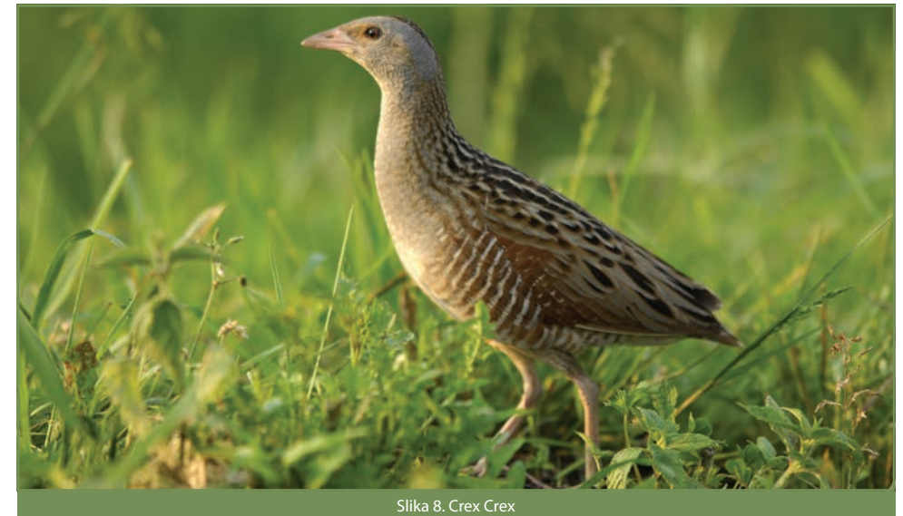
Slika 8. Crex Crex

Ženka kosca gnijezdi radeći plitku udubinu u tlu, obloženu lišćem i okolnom vegetacijom pa zaraštanjem travnjaka vegetacija postaje pregusta i previsoka za gniježđenje, dok intenzivna ispaša ostavlja prenisoku vegetaciju, također neprikladnu za kosca. Većina kosca gnijezdi se od 15. svibnja