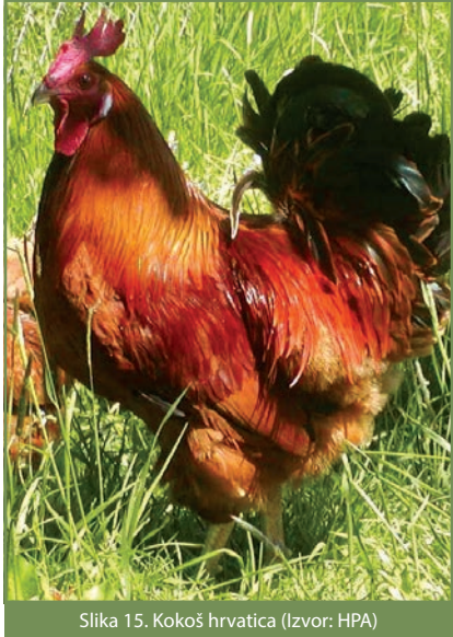
Slika 15. Kokoš hrvatica