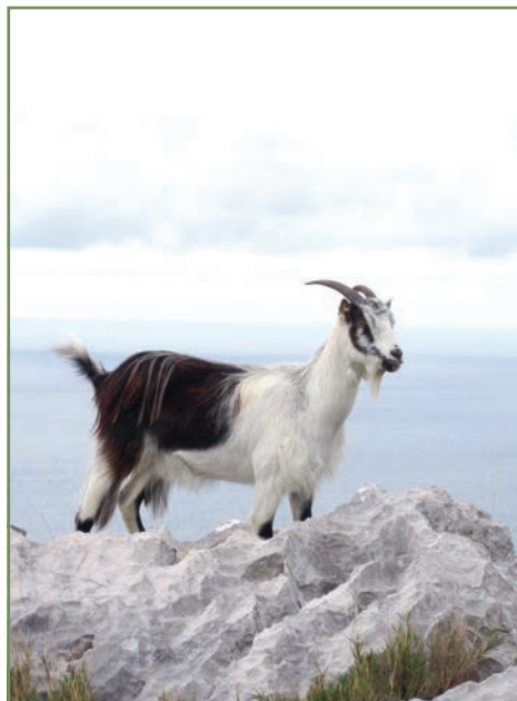
Slika 18. Hrvatska šarena koza