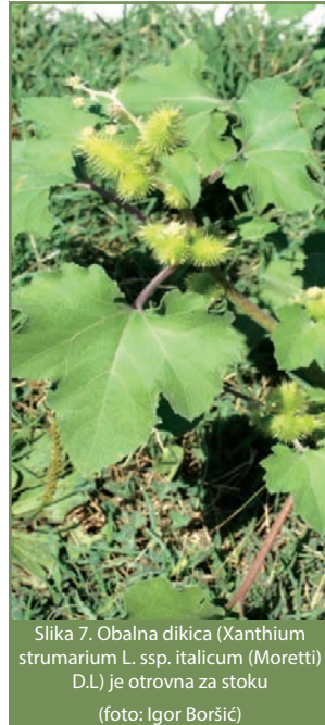
Slika 7. Obalna dikica (Xanthium strumarium L. ssp. italicum (Moretti) D.L.) je otrovna za stoku