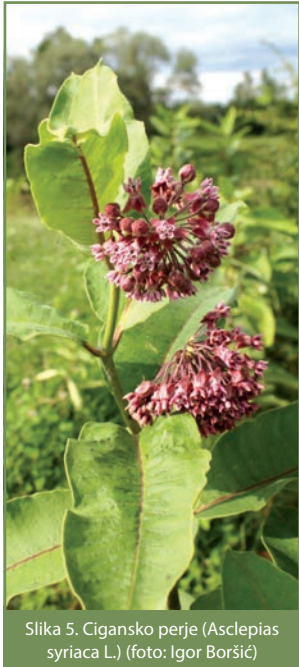
Slika 5. Cigansko perje (Asclepias syriaca L.)