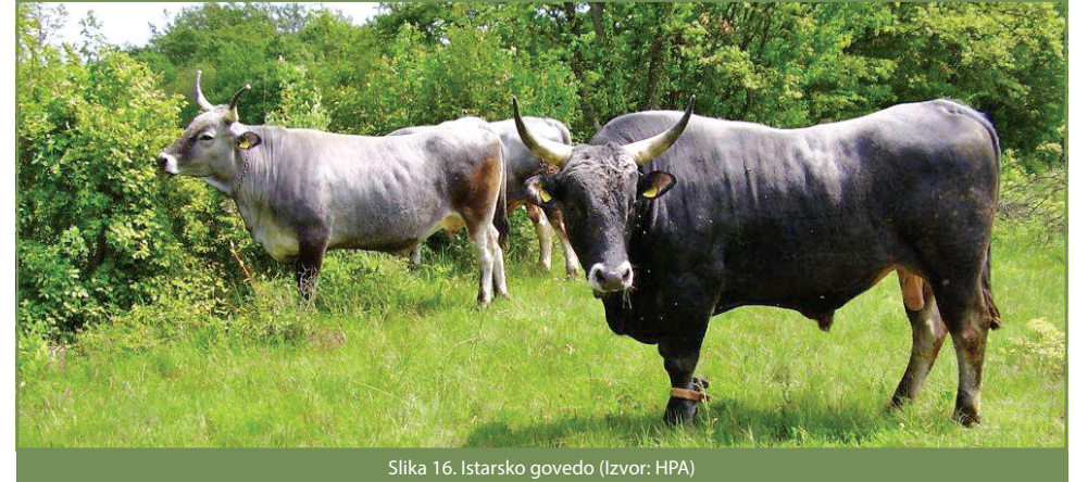
Slika 16. Istarsko govedo

Nastanak prirodnih okolnosti mora se evidentirati u propisanim registrima na gospodarstvu i prijaviti u JRDŽ, te u roku od 10 radnih dana od dana kada je smanjenje utvrđeno pisanim putem obavijestiti Agenciju za plaćanja u poljoprivredi, ribarstvu i ruralnom razvoju.