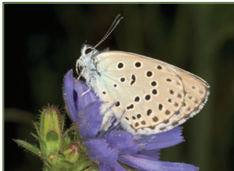
Slika 11. Močvarni plavac ( Phengaris alcon alcon )

Očito je da košnjom na točno određeni način i u određeno doba godine omogućujemo je nesmetan razvoj leptira. Kroz dulji period provođenja ove operacije brojnost četiri ugrožene vrste leptira će se povećati.