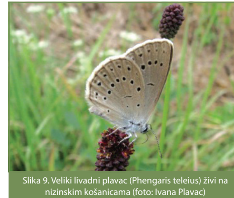
Slika 9. Veliki livadni plavac ( Phengaris teleius ) živi na nizinskim košanicama

Kako bi se zaštitile ove četiri vrste leptira, potrebno im je osigurati nesmetan razvoj i zadržati njihova staništa u izvornom obliku kroz prilagođeni način košnje.